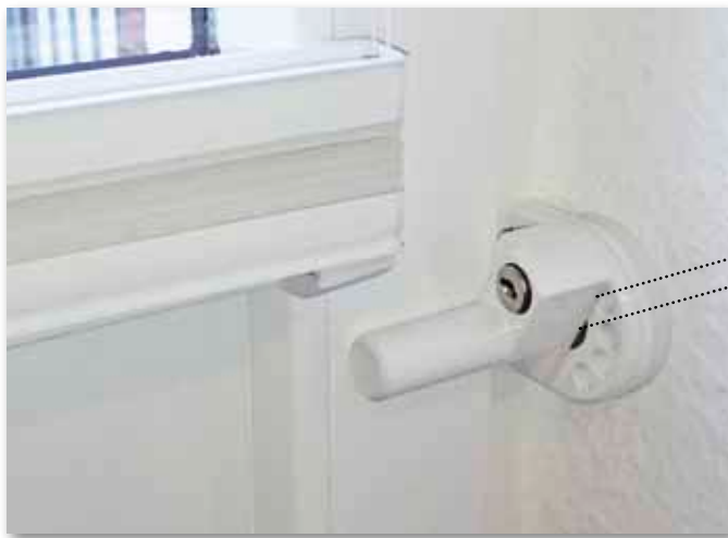
BS1-Z in verriegeltem Zustand.*

An den Bandseiten von Fenstern und Türen ist oftmals kein Platz für einen Sicherheitsbeschlag. Wenn der Fensterflügel sich nicht mehr öffnen lässt, weil der Beschlag dies blockiert, ist guter Rat teuer.