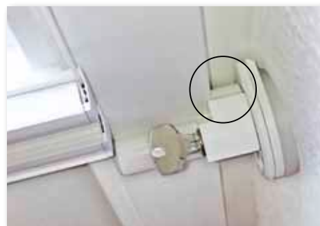
Der Verriegelungsmechanismus nutzt den Raum zwischen Flügel und Leibung.*